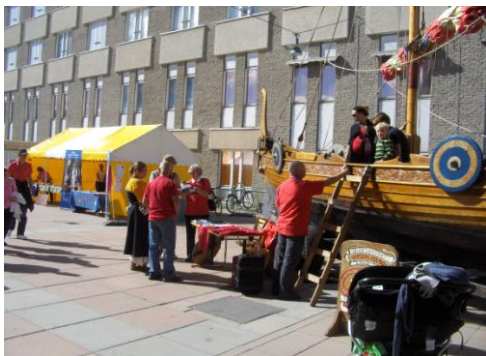
Bok-och tröjbord vid skeppet