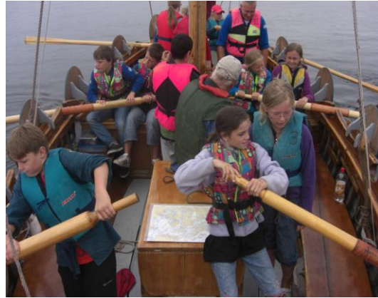
Rodd av små sjöscouter!