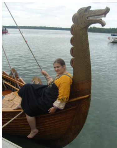
Så här skönt hade Moa det ombord!