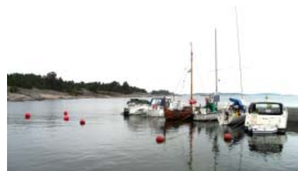
Gästhamnen på Fjärdlång

Lördag. Avgång 10 00 med första målet Dalarö för bunkring samt hämtning av kvarglömd necessär. Soligt och som vanligt motvind men inte så stark. Vid början av Baggensstaket la vi till för lunch. Färden flöt på men så äntligen på Askrikefjärden kunde vi sätta segel. Det gick med 4 till 5 knop fram till Stora Värtan då vinden mojnade. Vi angjorde Viggan 1630 efter en trevlig sjötur på 165 nautiska mil.