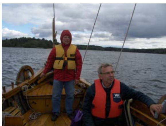
Höfding Järnruste vid rodet