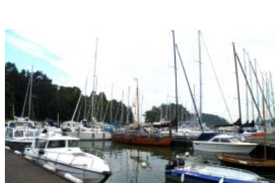
Viking Pltm i Utö gästhamn