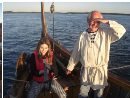
Solen i ögonen.