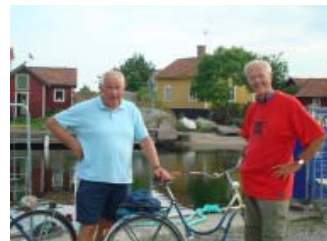
Vikingar med cyklar