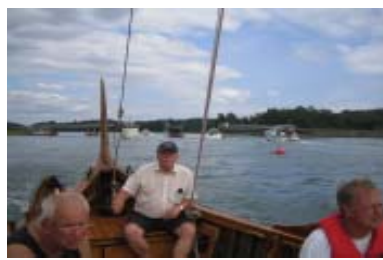
Svängbron vid Tottnäs