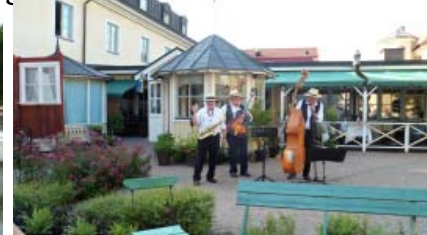
Scenen på stadshotellets innergård