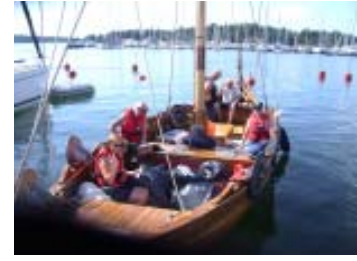
Gästhamnen i Nynäshamn

Onsdag när vi kastar loss 10 30 är det vackert väder men motvind. Vi går sydlig kurs för att vika av mot SV genom Dragets kanal där vi naturligtvis får möte. Allt gick emellertid bra. Vi fastnar till vid Tottnäs bro och i väntan på broöppning hann vi äta medhavd lunch, förtöjda vid en ditlagd anöringsboj. Efter Svärdsfjärden och Fifongsdjupet passerar vi Revudden, ett välbefolkat havsbad, för att slutligen nå vandrarhemmet Snipan, lägst in i Trosaån 15 00 .