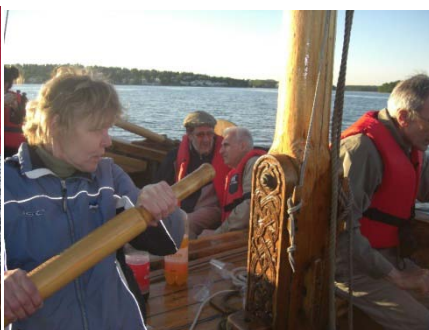
Lite rodd skadar inte.