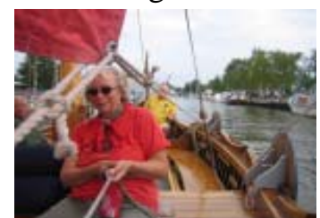
Viking Plym seglar i Trosaån