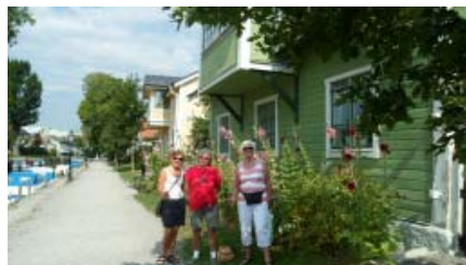
Vackra sköldmöer i Trosa