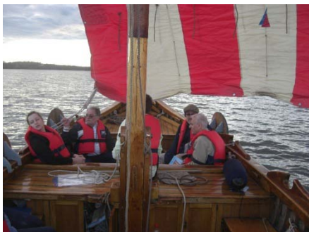
Hej vad det går.

Vädret var varmt och skönt och humöret på topp det var en blandning av gamla och unga schackspelare från olika länder som kom ombord på VP så det var många olika språk som surrade i luften. Vi fick också bidrag till skeppets bevarande vilket tacksamt togs i mot.