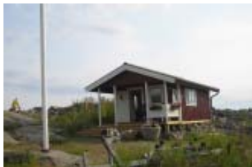
Vår hyrda stuga