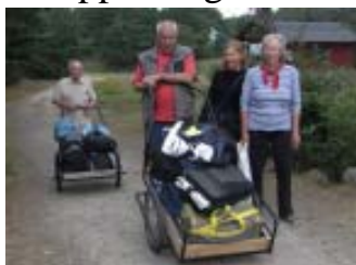
Vikingar på väg