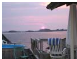
Bastu vid solnedgång