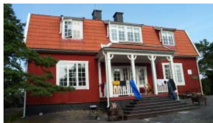
Vandrarhemmet på Fjärdlång