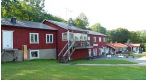
Vandrarhemmet i Nynäshamn